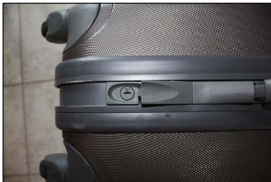
Obr. 4: Zabezpečte Vaše zavazadla.

V případě individuální dopravy hromadnými dopravními prostředky a organizované dopravy (např. s cestovní kanceláří) Vám odpadají starosti o vozidlo, trasu cesty a bezpečnost při jízdě. Avšak kromě výše uvedených bodů, týkajících se dokladů, pojištění a očkování musíte dbát navíc o: