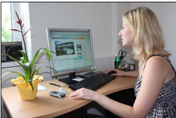
Obr. 2: Zjistěte si co nejvíce informací.