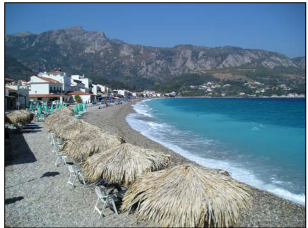
Obr. 1: Prožijte dovolenou bez problémů.

Pobyť – při pobytu může dojít k odcizení vozidla, zavazadla nebo cenností z něj, ke zranění nebo zdravotním potížím způsobeným místním klimatem a hygienickými podmínkami, ke ztrátě orientace (např. při pěší túře), přepadení v nebezpečné lokalitě, nedostatku peněz (např. problémy s platební kartou), problémům s policií nebo místními obyvateli při nedodržování místních předpisů a zvyklostí, zasažení mimořádnou událostí nám neznámého typu (tsunami, zemětřesení, sopečná činnost, apod.).