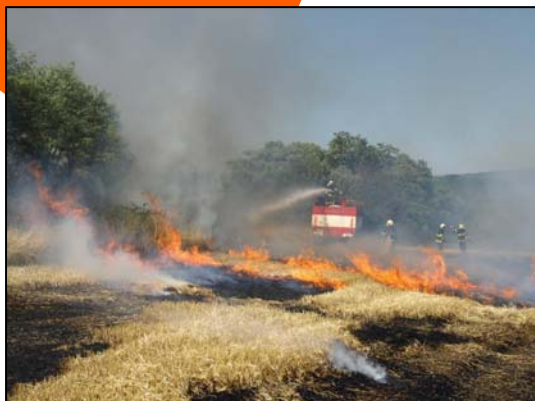
Obr. 1: I odhozený nedopalek cigarety může způsobit rozsáhlý požár.

Víte, jak bezpečně rozdělávat oheň v přírodě nebo proč nevypalovat trávu? Hasičský záchranný sbor JMK ve spolupráci s Policií ČR – Krajské ředitelství Brno a Diecézní charitou Brno Vám poradí, jak všechny tyto události bezpečně zvládnout.