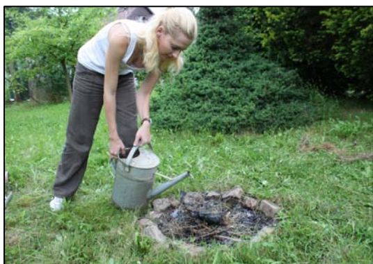
Obr. 3: Oheň vždy řádně uhašte.

kouřit a popel i půda pod ohništěm musí být chladné. Pamatujte, že i ve zdánlivě zcela vyhaslém ohništi se mohou skrývat žhavé oharky a poryv větru je znovu rozdmýchá a oheň roznese do okolí.