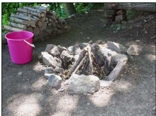
Obr. 2: Nachystejte si předem dostatek vody na uhašení.

ochraně ovzduší v otevřených ohništích nelze pod hrozbou vysokých pokut spalovat žádné chemické látky (např. plasty, pneumatiky...).