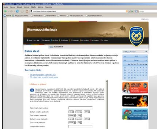
Obr. 5: www.firebrno.cz/paleni-klesti

ale je dobré, pokud dochází k dlouhodobému pálení nebo pálení mimo obytnou zónu, nahlásit tuto činnost na linku 112 nebo 150 a mít na místě pálení mobilní telefon a jednoduché hasební prostředky (lopatu, vědro s vodou apod.). V Jihomoravském kraji je také možné nahlásit pálení klesť pomocí internetového formuláře na stránce www.firebrno.cz/paleni-klesti .