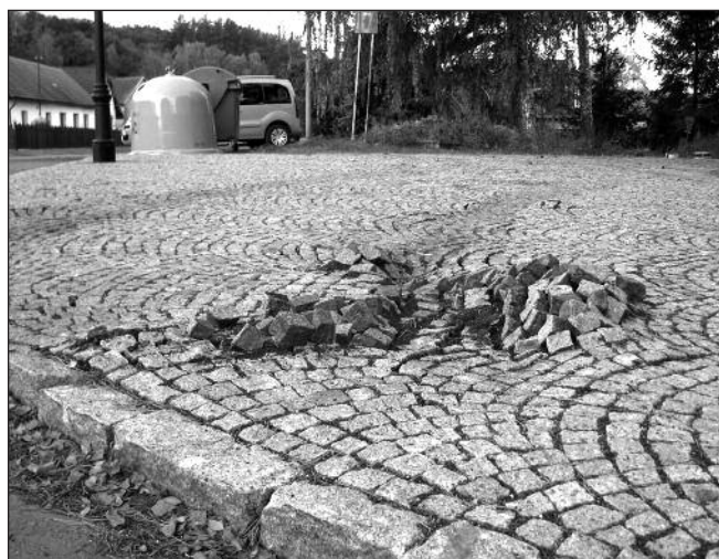
Poňčená dlažba u fary.