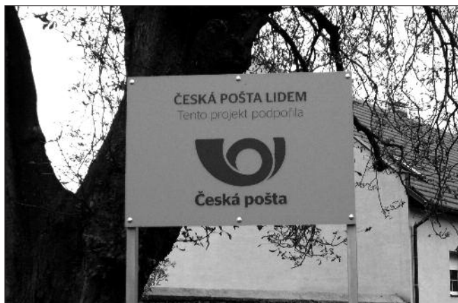
Česká pošta podpoří výstavbu veřejného osvětlení v Limuzích.