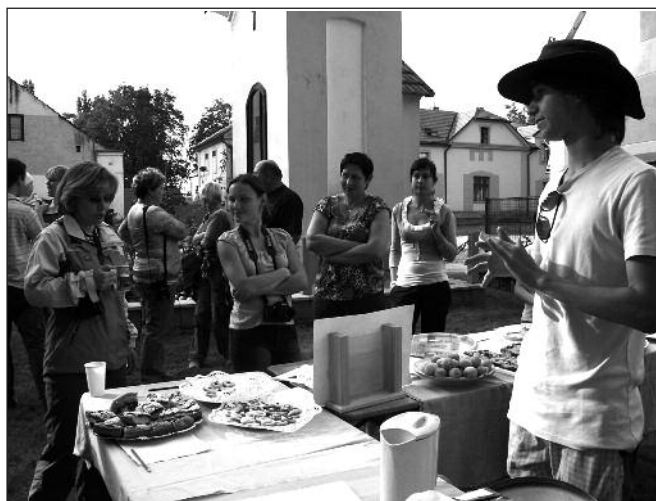
Když ono je to všechno tak dobré!