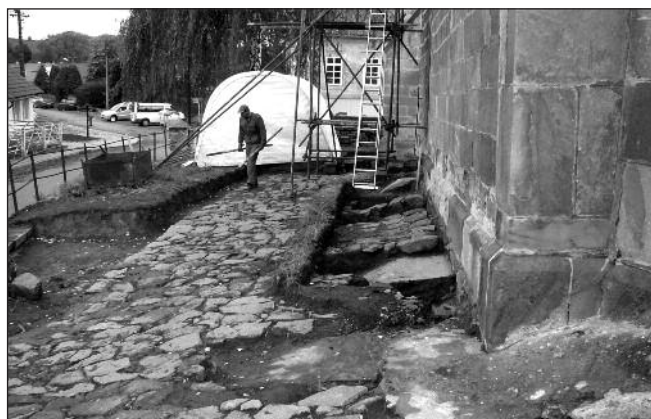
Původní dlažba barokního typu.