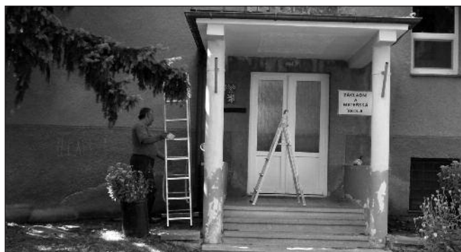
DeDo v akci.