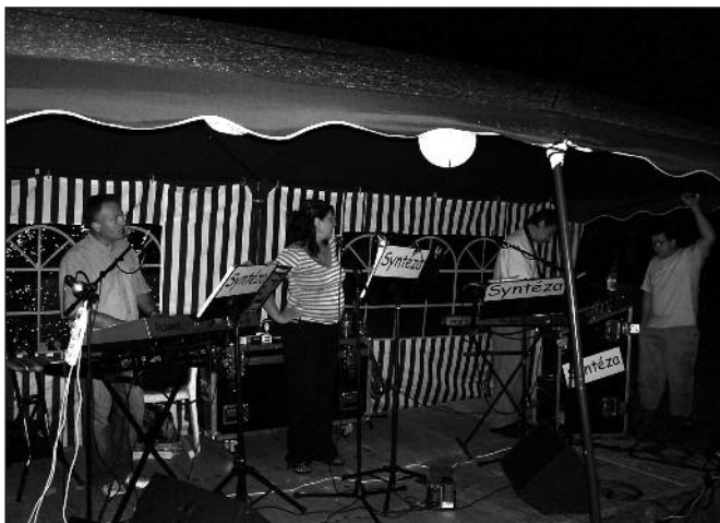
Hraje a zpívá syntéza.

hodin", ale myslíme, že se akce vydařila. Pomozte nám zhodnotit tuto akci i Vy na www.sdhtismice.cz . Chtěli bychom, aby se z této zábavy stala do budoucna každoroční tradice. Doufáme, že se všem návštěvníkům na naší zábavě líbilo a zůstanou nám věrní i v dalších letech.