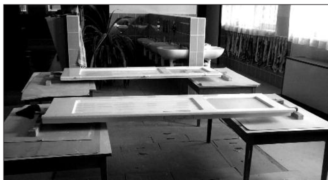
Všude samé dveře naležato...