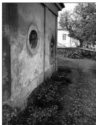
Zde byl průzkum dokončen.