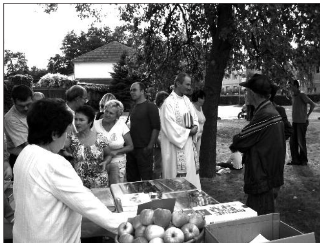
Všem bylo milo a dobře.