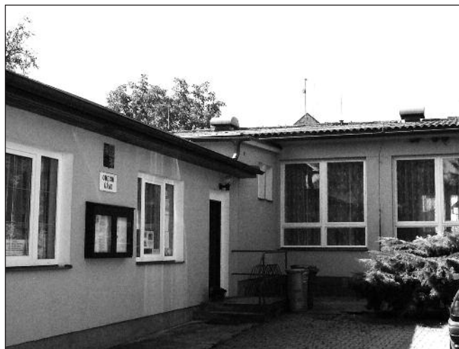
Kulturáček v Tismicích.