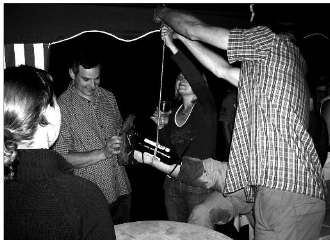
Vyvrknutý kotník je nutno chladit...