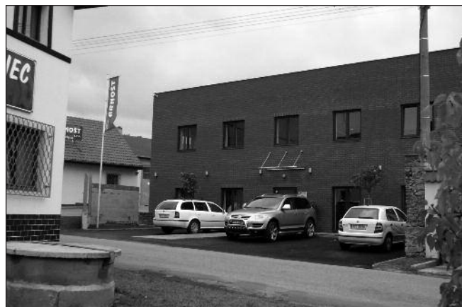
Nová administrativní budova firmy Arnošt.