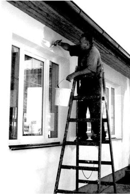
DEDO v akci