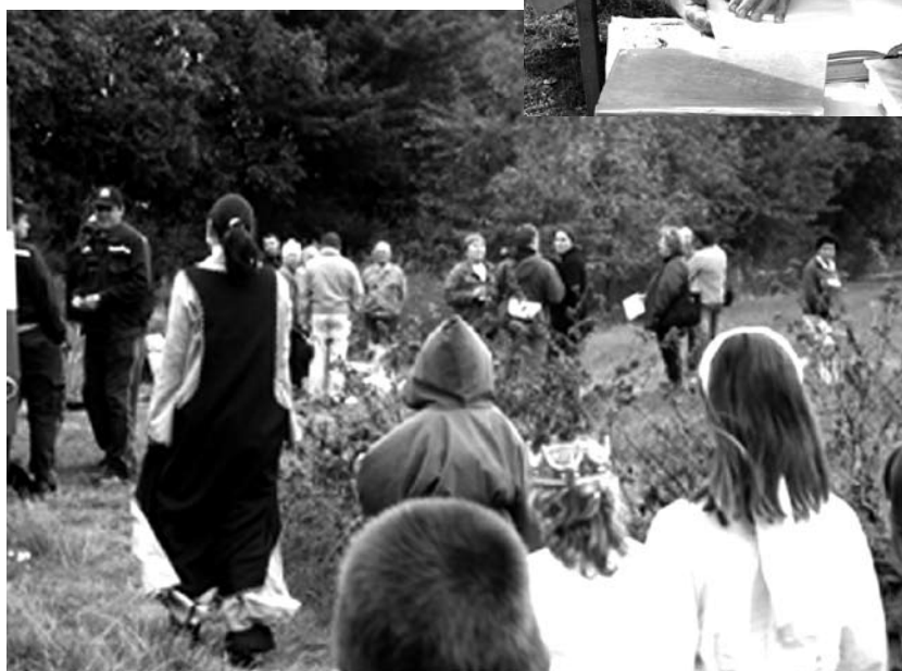
Výprava na slovanské hradiště