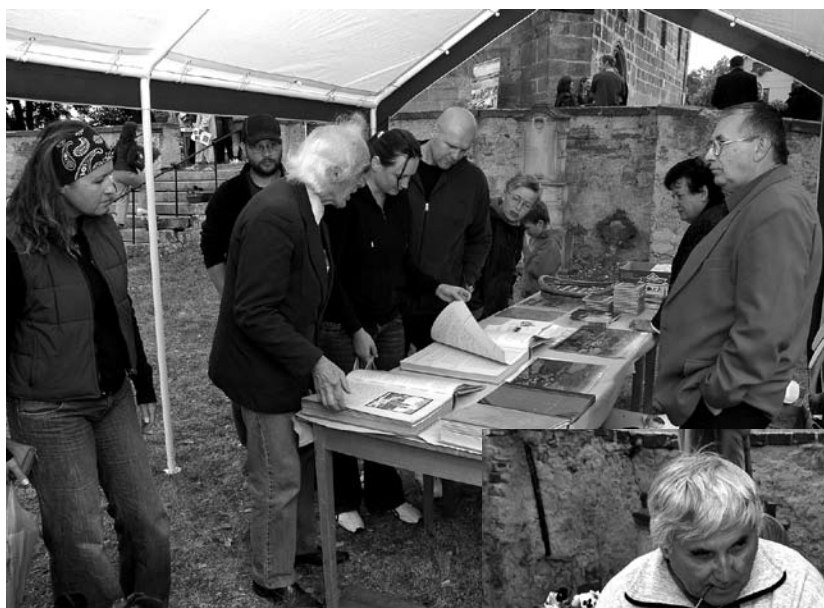
Velký zájem byl o zápisy ze starých obecních kronik