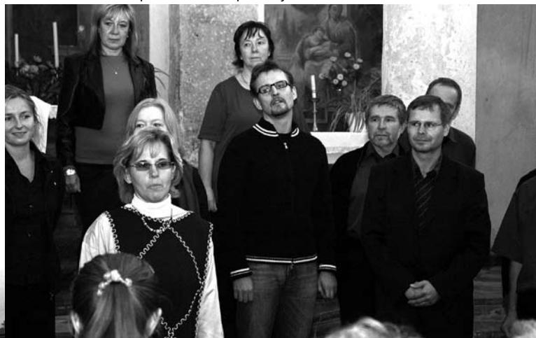
Starostka obce přivítala hosty i nového faráře