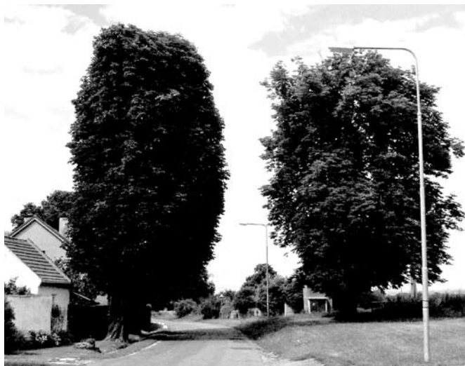
Jírovce u Benáků