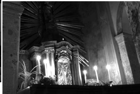
Basilika při svíčkách