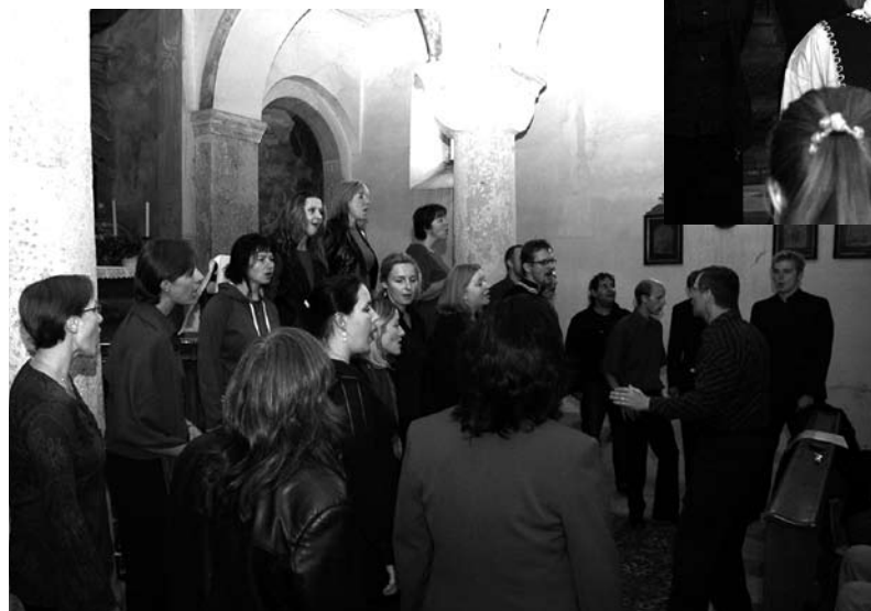
Geshem v plném nasazení