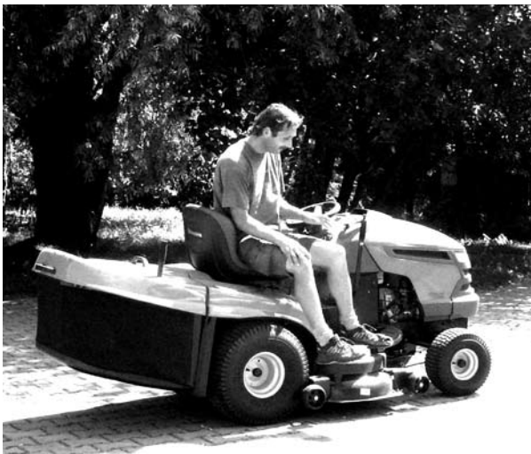
A jde se na to ....