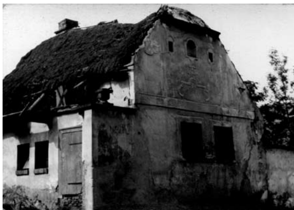
Limuzy 1, bývalý nejstarší dům