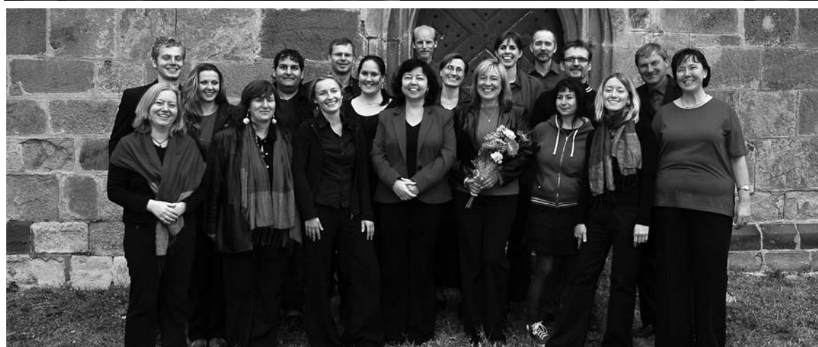
DNY EVROPSKÉHO HISTORICKÉHO DĚDICTVÍ TISMICE – 14. září 2008