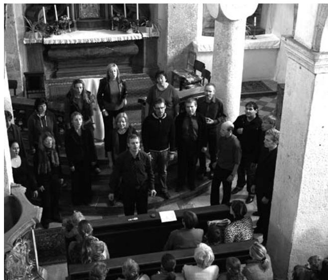
Geshem zpívá černošské spirituály